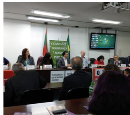
Foto: Diretores do SINTEC-RS em audiência pública que debateu a privatização da Trensurb.

defender a manutenção das empresas sob comando do Estado preservando assim, o patrimônio da sociedade. Qualidade no serviço com modicidade tarifária e instrumentos para promoção do desenvolvimento e da qualidade de vida dos gaúchos são os principais benefícios associados às empresas públicas.