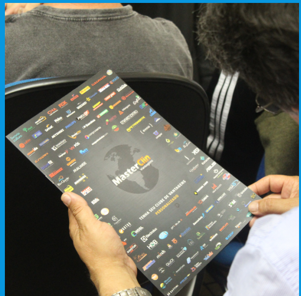
Foto: Apresentação do Cartão de vantagens Masterclin.

O aumento no número de associados ao SINTEC-RS também é resultado da atuação da Gestão. No total, foram 321 novos sócios. A Diretoria ainda promoveu a Campanha de Sindicalização 2018 e a Campanha de Sindicalização 2019, que resultaram em 43 e 46 novos sócios, respectivamente. As campanhas de sindicalização tem o objetivo de fortalecer a luta pelos interesses e direitos dos técnicos industriais, destacando que a participação da categoria é fundamental para construir uma entidade forte, pois as entidades representativas dos trabalhadores necessitam de recursos para se contrapor ao poder das entidades empresariais. A campanha de 2018 sorteou uma viagem para o Rio de Janeiro, para participação da 33ª edição do Cinase, enquanto a campanha de 2019 sorteou uma smart TV 43", ultra 4K com inteligência artificial para os novos sócios e um smartphone 128GB, 4G e com câmera tripla para o responsável pela indicação do novo sócio. Além fazer parte de uma entidade que atua há mais de 30 anos em defesa da valorização do técnico industrial, os profissionais associados ao SINTEC-RS contam com diversos benefícios, como plano de previdência privada para sócios e seus dependentes, descontos em instituições de ensino superior e escola de idiomas, descontos em farmácias e estacionamentos, assessoria jurídica com mais de 30 anos de experiência e todas as vantagens do cartão Masterclin. Se você ainda não é sócio do SINTEC-RS, associe-se. Juntos, somos mais fortes!