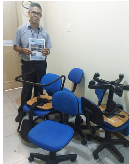
Foto: coleta das cadeiras doadas pelo SINTEC-RS para a Pequena Casa da Criança

jovens e idosos. O sindicato fez a doação de sete cadeiras de escritório para a instituição. Estas ações reforçam o compromisso do SINTEC-RS com práticas de responsabilidade social, que buscam impactar positivamente na sociedade.