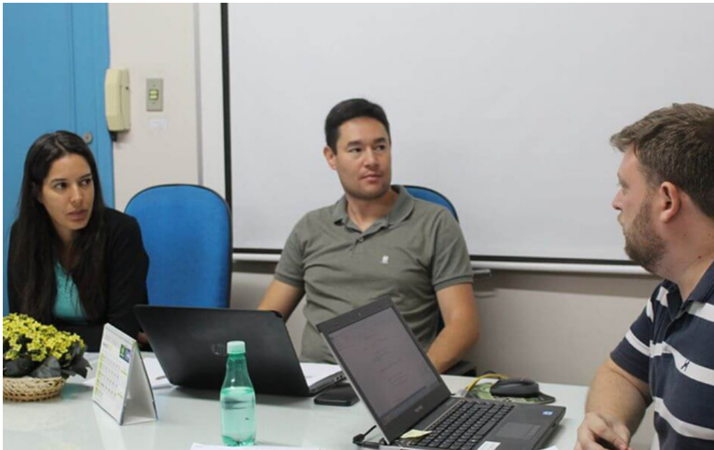
Foto: reunião de diretoria

obteve autorização através de assembleia dos associados para realizar a permuta dos conjuntos 53, de propriedade do SINTEC-RS, e 113. Com isso, o conjunto 113, que era alugado há mais de 20 anos pelo sindicato, foi integrado ao patrimônio do SINTEC-RS, possibilitando as reformas e melhorias necessárias na entidade.