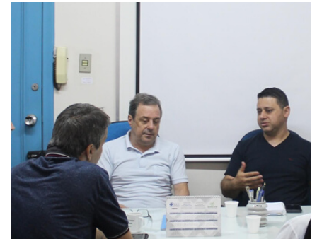
Foto: reunião de diretoria

comunicação sindical. O investimento em ferramentas de comunicação visa trazer mais visibilidade para o sindicato no ambiente digital.