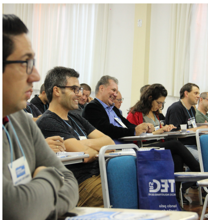
Foto: Seminário de Formação Sindical

práticas sindicais. Os aspectos referentes às atividades do SINTEC-RS foram apresentados pela Diretoria Executiva em parceria com a Assessoria Jurídica da entidade, o FORBRIG Advogados. Já as dinâmicas de integração foram realizadas pela empresa Hub 528Hz. Para os representantes do