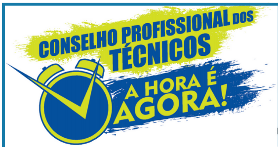
Foto: Campanha do SINTEC-RS pela criação do Conselho Profissional dos Técnicos

do Conselho Profissional exclusivo da categoria. O sindicato destaca que essa conquista significa a independência dos profissionais técnicos industriais em nosso país, que poderão exercer suas atividades com plenitude junto a sociedade.