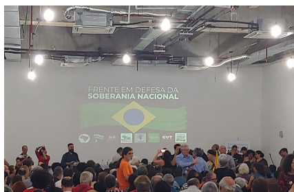
Foto: SINTEC-RS no ato de lançamento da Frente em Defesa da Soberania Nacional.

O SINTEC-RS durante a gestão 2017/2020 promoveu diversas ações em defesa das empresas públicas.